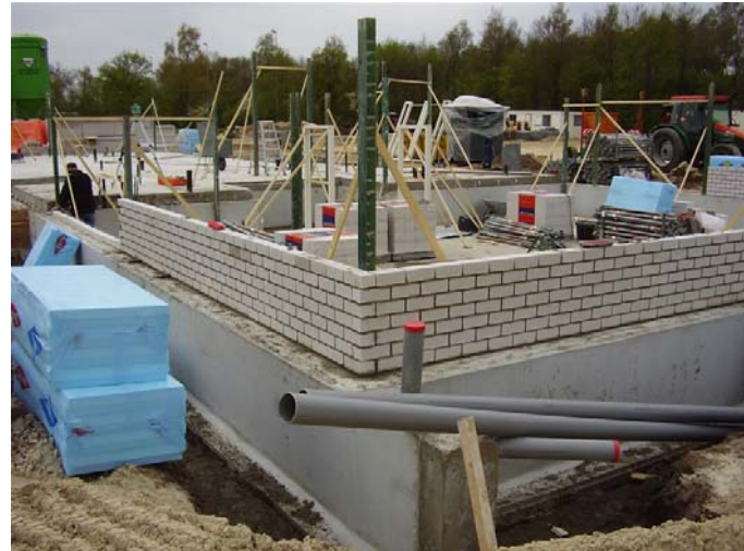
1 e muurtje metselen