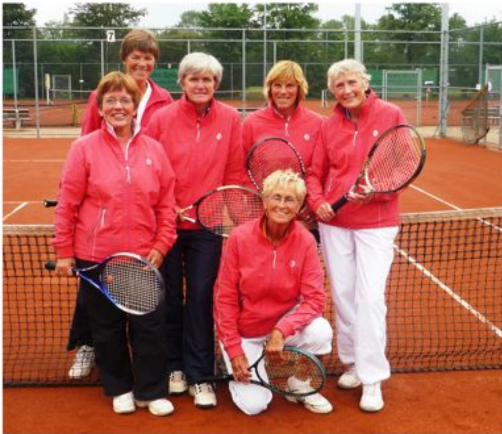
Dinsdag Dames 45+