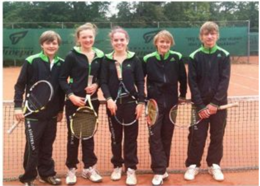
Junioren zondag gemengd 1