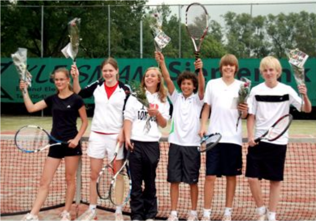
Junioren zondag gemengd 2