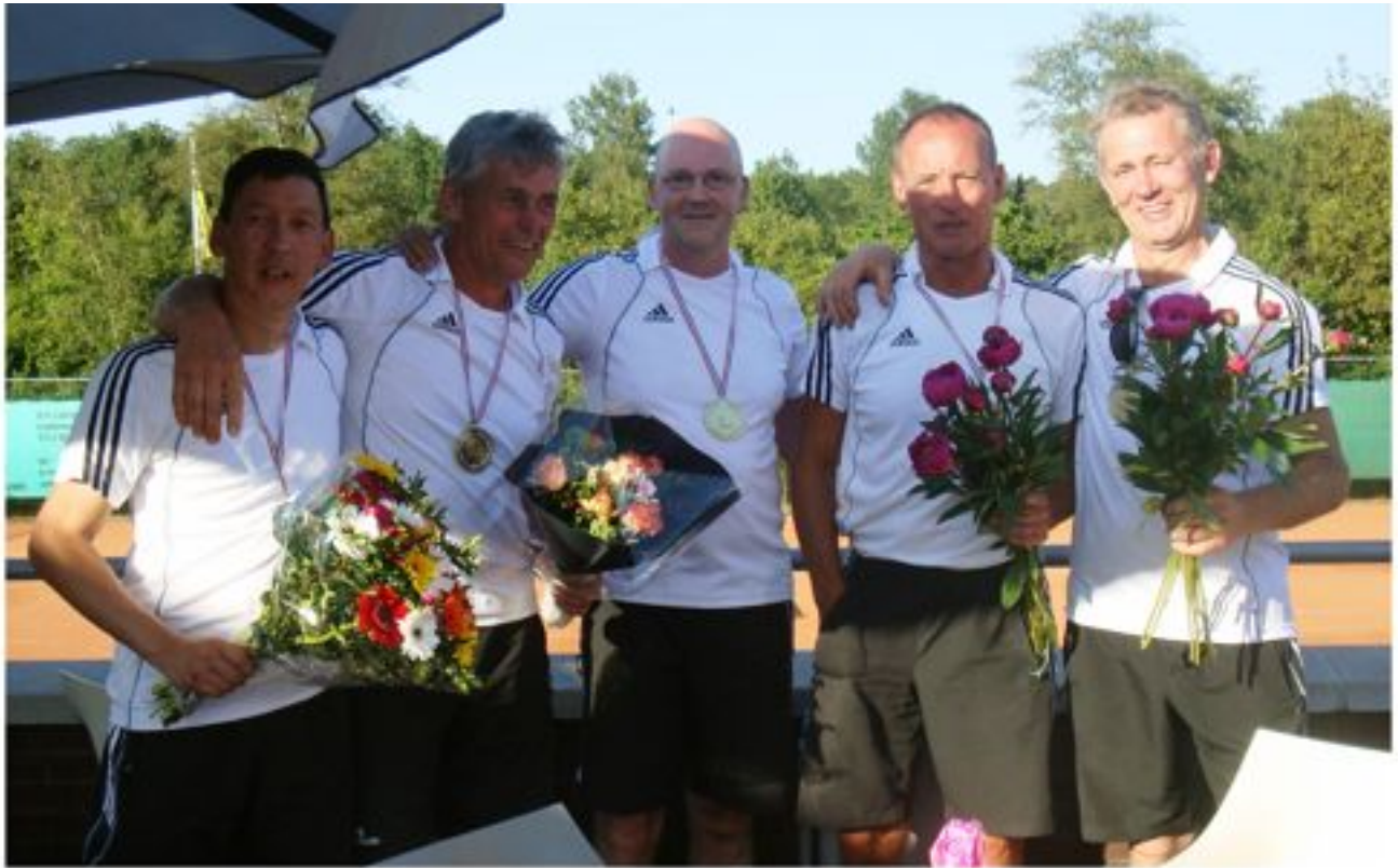
Zaterdag Heren 9