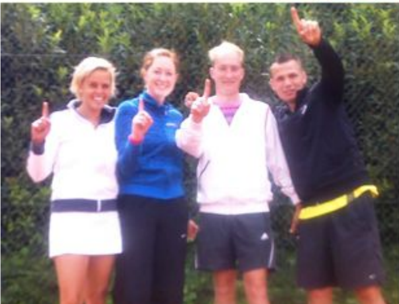
Senioren Zondag gemengd 3